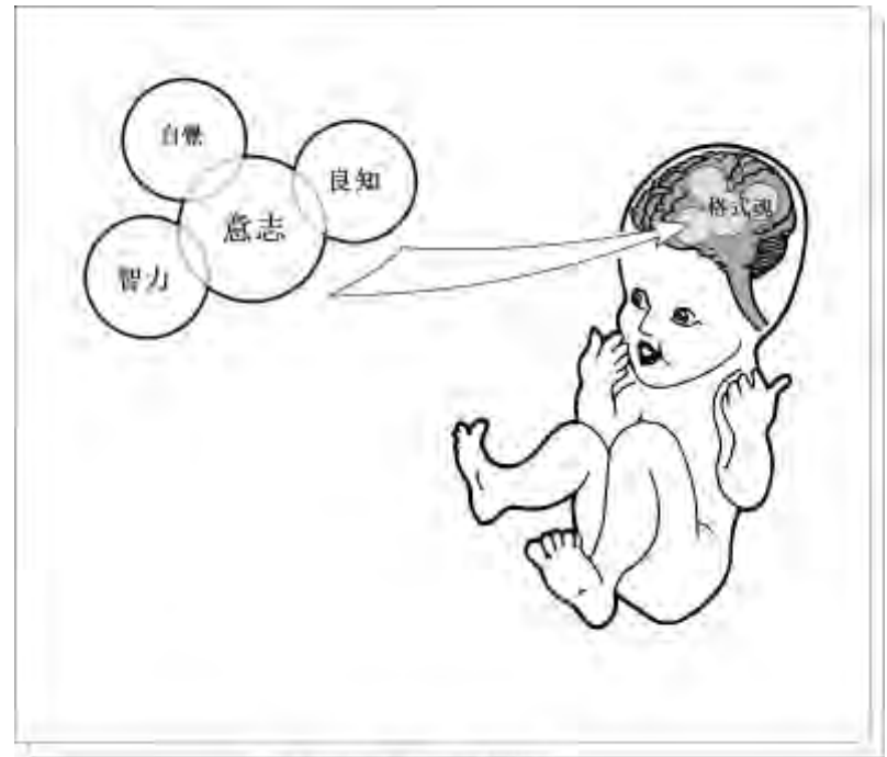
在出生時魂生命的傳授

生那一刻的點燃、胎兒才成為一個活生生的人。格式魂解釋了我們如何從我們的父母那裡繼承心理和行為的特質。